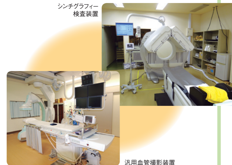
シンチグラフィ検査装置