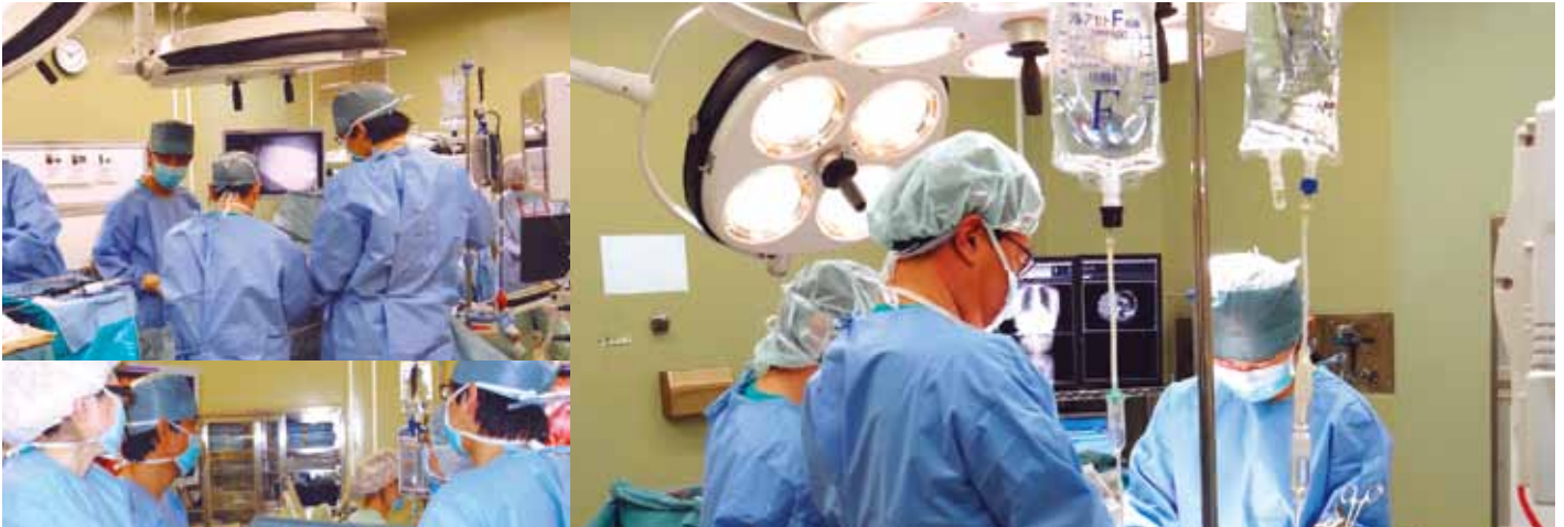
同愛記念病院 外科